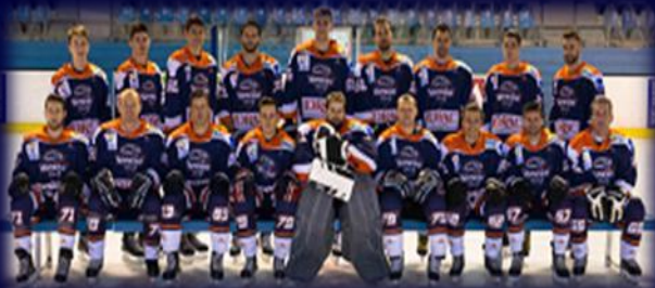
Equipe Réserve - Division 3

Engagement ENTRAIDE Humilité Discipline Maitrise de soi Perseverance Proximité humaine Dépassement Respect FRATERNITÉ Plaisir