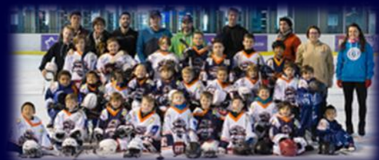
Ecole de Hockey